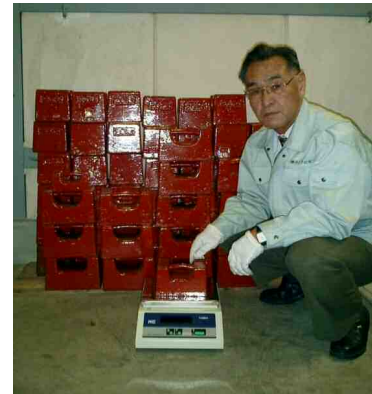
一級基準分銅で分銅校正用マスコンパレーターを当社計量士が校正 当社使用の「実用基準分銅」を校正

最初は元気だったばかりも 長期間使用していると使用条件や環境等により、思わぬ誤差を生じさせます。生産管理や品質管理を効率良く行うためにも、定期的なはかりの検査をお勧めします。当社ではベテランスタッフの元、計量法・ISOに対応した計量管理をサポート致します。又分銅・温度計・ノギス等幅広い計量器も対応致します。お問い合わせご質問等ご用命下さい。メールでもお受けさせていただきます。